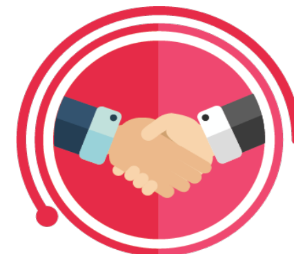
GRUPO MANTENEDOR PESSOA JURÍDICA