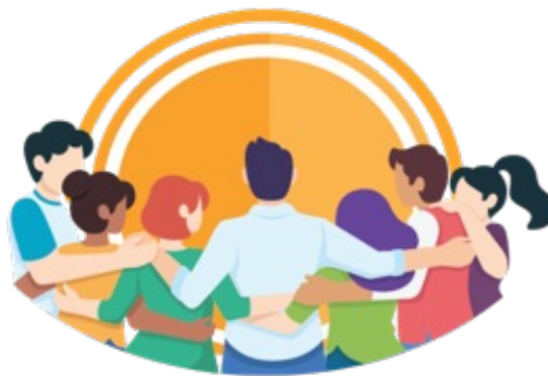
GRUPO MANTENEDOR PESSOA FÍSICA